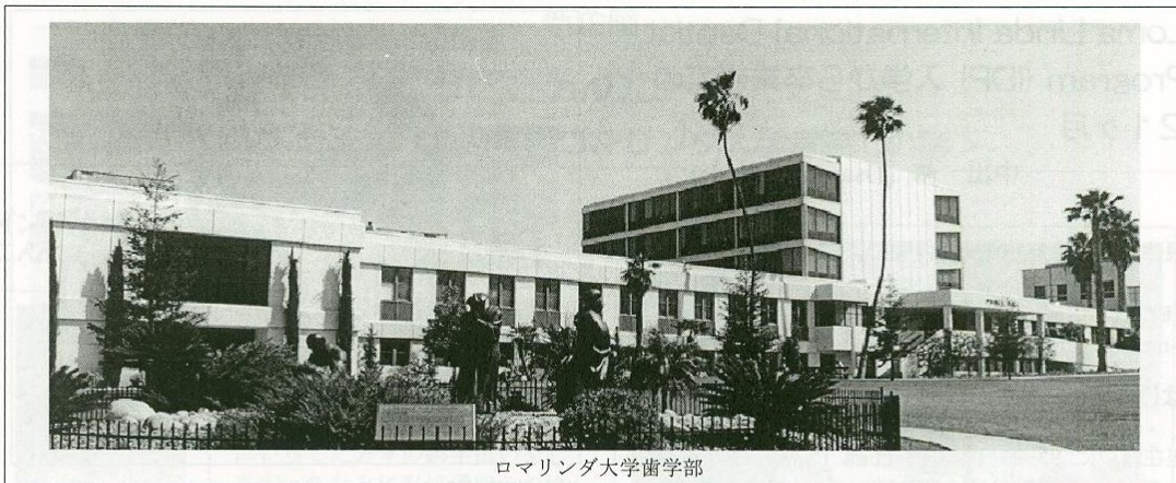
ロマリンド大学歯学部

かぎり、つきまどってきますからね。そういう点で、入学前に徹底して英語力は鍛えてきた方がいいでしょうね。クラスメートは少なくとも私よりは英語力がありません。特にインド人などは母国語ですから、アクセントはひどいものの総合的な英語力には全く問題がなく、うらやましく思ったものです。しかしながら、考えてみれば、彼らは日本人よりは経済的に苦労していることが多く、そういう点で、神は平等な試練を与えているようにも感じたのも事実です。